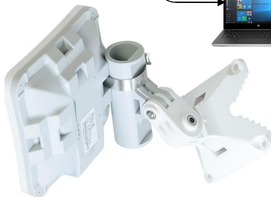
Vägg- och Mastfäste finns som extra tillbehör Art.nr. 105-15