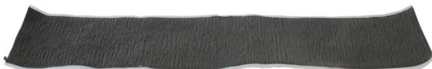
Art.nr. 135-04 Takstos-manschett av vulkaniserande gummi 90x490 mm