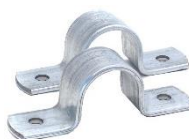
Art.nr. 132-04 Rörklammer 38 mm