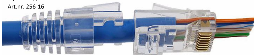
RJ45 Brytskydd Pass Through Frp. 100st/påse Art.nr. 256-16

Guldbelagd trippelspets för perfekt kontaktering!