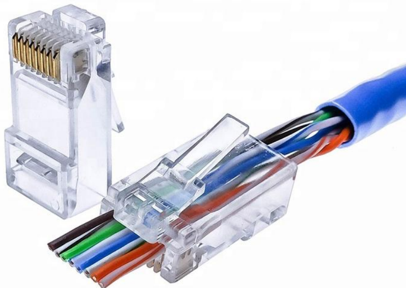
RJ45 Hane Pass-Through Cat6 – UTP Frp. 100 st/box Art.nr. 255-16

Pass-through RJ45 kontakt där innerledarna tydligt dras igenom kontakten för garanterad korrekt och snabb anslutning.